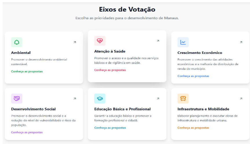
Imagem 3 - Eixos de votação da Consulta Pública PPA-LDO-LOA 2026