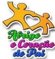
Imagem 17 - Ofício n° 369/2025 do Abrigo O Coração do Pai

Fonte: Autos PA N° 09.2025.00000028-3, pág. 930.