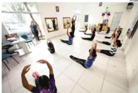
Instituição ao longo de quatro décadas já atendeu mais de 16 mil pessoas

A Casa Mãe Margarida, Organização da Sociedade Civil (OSC), irá completar, no próximo dia 2 de abril, 40 anos de serviços prestados para os mais vulneráveis. A entidade, administrada pela Irmãs Salesianas com apoio do Estado e da Prefeitura, cuida e acolhe crianças e adolescentes vítimas de violência, abuso sexual, abandono. Ao longo das quatro décadas já atendeu mais de 16 mil pessoas, no bairro São José 2, zona leste. A entidade atende cerca de 300 meninas ao mês em duas modalidades. A Proteção Social Básica oferece atendimento socioeducativo para 280 crianças e adolescentes e uma escola de tempo integral do Ensino Infantil ao Fundamental 1 (5º ano) que funciona em cooperação técnica com a Secretaria Municipal de